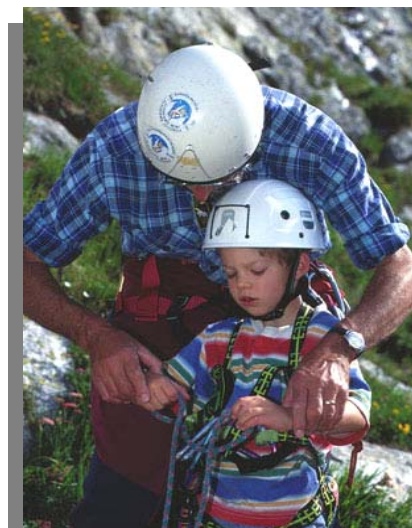
Beim Familienbergsteigen kommen auch die Kleinsten zum Zug.

gemeinsam mit ihren Kindern Aktivitäten. So kommen auch Kinder unter 10 Jahren im SAC zum Zug, denn auch die finden Klettern und Bergsteigen toll, nur eben etwas anders als die KiBe-ler und JO-ler.