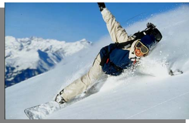
....und dann die rasante Abfahrt im stiebenden Pulverschnee.

Ab ca. 14 Jahren machst du bei der JO (Jugendorganisation) mit. Die JO hat sämtliche Bergsport-Aktivitäten auf dem Programm: Im Sommer sind es vor allem Bergtouren (Fels und Eis) und Sportklettern, im Winter Ski- und Snowboardtouren, Eisklettern und Sportklettern in der Halle. Obschon die Aktivitäten in der JO durchaus leistungsorientiert sind, finden auch weniger leistungsstarke ihren Platz in der Gruppe. Die Jugendlichen lernen so, aufeinander Rücksicht zu nehmen und Verantwortung zu übernehmen. Ziel des Leiterteams ist es, die Jugendlichen zu selbständigen, verantwortungsbewussten Alpinisten auszubilden.