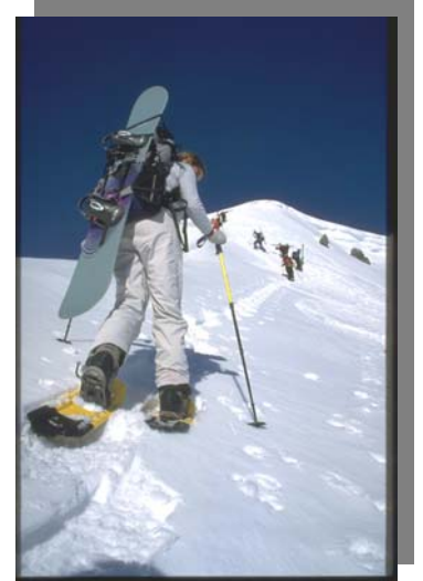
Aufstieg mit Schneeschuhen...

Die jüngsten gehen zusammen mit den Eltern auf Tour (Familienbergsteigen, ca. 6 - 10 Jahre, vgl. Rückseite). Ab ca. 10 - 14 Jahren ist die KiBe-Gruppe (Kinderbergsteigen) für dich die richtige Adresse. Dort lernst du Klettern, machst erste einfachere Bergtouren im Fels und auf dem Gletscher, erkundigst Höhlen oder erlebst mit anderen Kindern tolle Tage oder Lagerwochen in der Natur. Im Winter machen die KiBe-ler einfache Touren im Schnee oder klettern in der Kletterhalle.