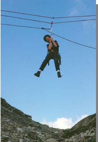
Action und Fun wird bei der JO gross geschrieben!